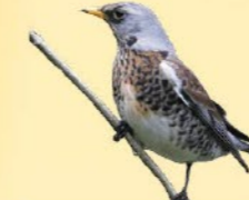
Grive litorne 22-27 cm Tête et dos gris, poitrine et flancs mouchetés. Souvent en groupe dans les arbustes épineux ou les prairies.