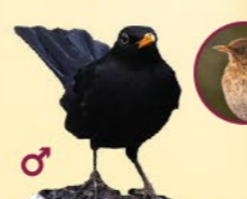
Merle noir 23,5-29 cm Noir avec bec orange ou brun.