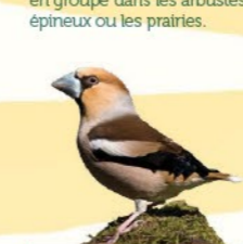
Grosbec casse-noyaux 16,5-18 cm Oiseau imposant au bec démesuré. En vol, lignes blanches sur les ailes et la queue.