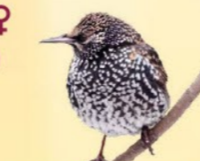
Étourneau sansonnet 19-22 cm Oiseau noir à la poitrine tachetée de blanc, souvent en groupe.