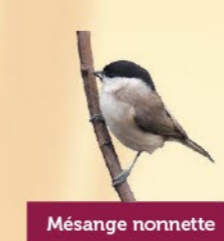
Mésange nonnette 11,5-13 cm Calotte entièrement noire, dos brun uni et ventre clair. Similaire à la mésange boréale.