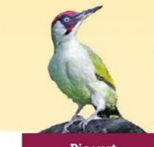
Pic vert 30-36 cm Souvent au sol à la recherche de fourmis. Oiseau élané au vol ondulant. Son cri est un rite caractéristique.