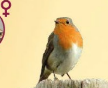
Rougegorge familier 12,5-14 cm Poitrine rouge, dos brun, comportement agressif.