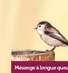
Mésange à longue queue 13-15 cm Petit oiseau à très longue queue. Oiseau grégaire, se déplaçant souvent en famille.