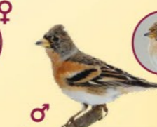
Pinson du Nord 14-16 cm Similaire au pinson des arbres. En vol, on observe une tache blanche au-dessus de la queue. Bec jaune-orange.