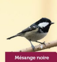
Mésange noire 10-11,5 cm Petite, sombre, avec des taches blanches sur les joues et l'arrière de la tête.