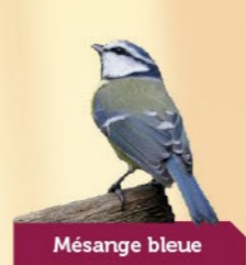
Mésange bleue 10,5-12 cm Petit oiseau à la poitrine jaune. Calotte bleu ciel, sourcils noirs.