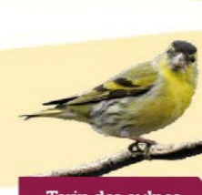
Tarin des aulnes 11-12,5 cm Petit fringille aux flancs striés avec bandes noires et jaunes contrastées sur les ailes.