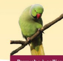
Perruche à collier 39-43 cm Cet oiseau exotique vert a colonisé Bruxelles et sa périphérie. Présent aussi dans quelques villes wallonnes.