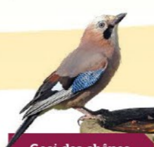
Geai des chênes 32-35 cm De la taille d'un pigeon, brun roux avec des taches bleues sur les ailes.