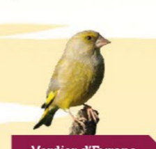
Verdier d'Europe 14-16 cm Bec court et épais, jaune-vert, généralement en groupe. Sensible aux maladies si les mangeoires ne sont pas nettoyées.