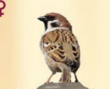
Moineau friquet 12,5-14 cm Bec court et épais, calotte brune, tache noire bien visible sur les joues.