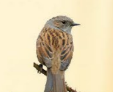
Accenteur mouchet 13-14,5 cm Poitrine rayée, tête gris bleuté, vagabonde au sol.