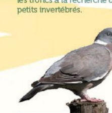
Pigeon ramier 38-43 cm Gros pigeon avec un collier blanc et des bandes alaires blanches bien visibles.