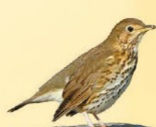
Grive musicienne 20-22 cm Dos et tête brun, poitrine blanche parsemée de taches en forme de pointe de flèche.