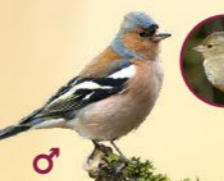
Pinson des arbres 14-16 cm Taille d'un moineau, bandes blanches nettement visibles sur les ailes.