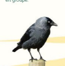
Choucas des tours 30-34 cm Petit corvidé vivant en groupes peu nombreux, avec la tête grise et des yeux pâles.