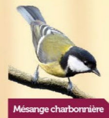
Mésange charbonnière 13,5-15 cm Ventre jaune avec « cravate » noire, joues blanches bien visibles.