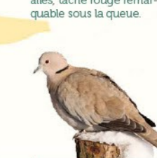
Tourterelle turque 31-34 cm Plumage beige avec collier noir interrompu.