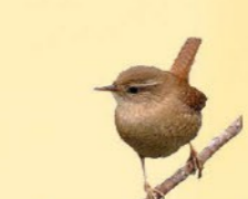
Troglodyte mignon 9-10,5 cm Tout petit oiseau vif, nerveux, avec la queue redressée.