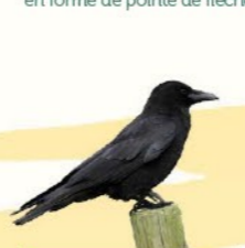
Corneille noire 44-51 cm Gros oiseau entièrement noir. Omnivore, elle utilise son intelligence pour s'adapter aux milieux anthropisés.