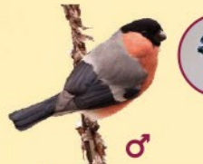
Bouvreuil pivoine 15,5-17,5 cm Oiseau trapu, remarquable par ses couleurs. Émet un sifflement caractéristique. Carré blanc au-dessus de la queue.