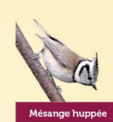
Mésange huppée 10,5-12 cm Petite mésange brune portant une huppe remarquable, fréquente les bois de conifères.