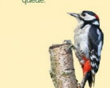
Pic épeiche 25 cm Joues blanches, grande tache blanche sur les ailes, tache rouge remarquable sous la queue.