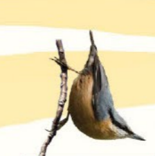
Sittelle torchepot 12-14,5 cm Silhouette dénuée de cou avec tête large et long bec. Arpente les troncs en sautillant.