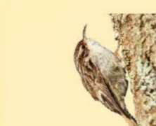
Grimpereau des jardins 12-12,5 cm Petit oiseau brun et blanc au long bec courbé. Escalade les troncs à la recherche de petits invertébrés.