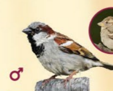
Moineau domestique 14-16 cm Bec court et épais, gris-brun, bavette noire et calotte grise. En groupe.