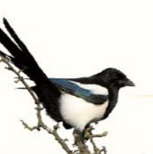
Pie bavarde 40-51 cm Tête et cou noir, grandes taches blanches sur la poitrine et les ailes, longue queue.