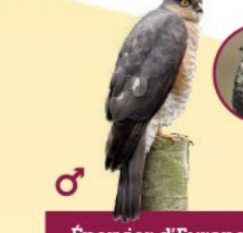
Épervier d'Europe 29-34 cm Petit rapace qui se nourrit exclusivement d'oiseaux. Chasse à l'affût près des mangeoires.